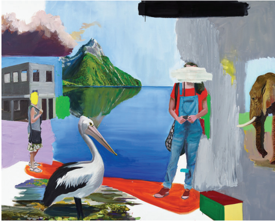
Touristes 2017 Huile sur toile, 160 x 190 cm

Philippe Fangeaux assemble des éléments de réalité qui devraient s'exclure mutuellement. Il nous invite donc à une lecture de chocs expressifs et d'articulations brutales qui finissent par déterminer les conséquences d'une réalité troublée sur laquelle on n'a pas de prise décisive, qui ne cesse de fuir tout en se laissant étrangement poursuivre. Il se dégage de sa peinture une certaine griserie.