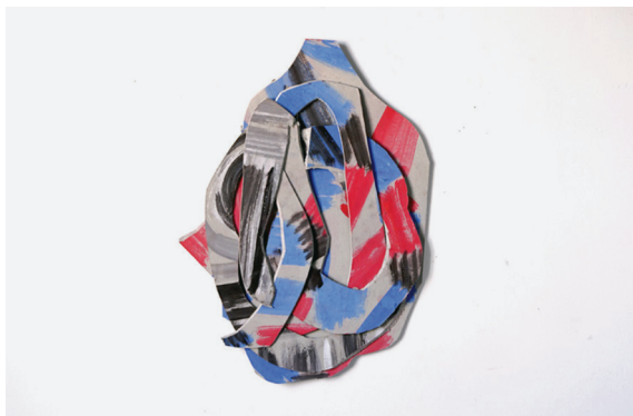
Découpage n°47 2015 Gouache sur carton, 58 x 42 x 1 cm

Jean Laube est peintre, à ce titre il réalise des œuvres dans lesquelles les motifs et la couleur organisent la composition de tableaux. Mais son travail de peintre passe aussi par l'assemblage d'objets, par des maquettes, ou de petites sculptures. Les gestes qu'il associe à sa pratique tiennent du découpage, du collage, du retournement, de l'empilement, il construit des architectures de cartons, propose des points de vue... il s'agit donc d'une peinture élargie, un art dont l'objet pourrait être l'espace, celui dans lequel on se trouve quand on fait face à l'œuvre, celui ressenti et questionné par l'artiste. Il y a invariablement du volume dans cette peinture, des objets certes (des Chambres qui une fois portés à l'œil livrent la vision d'espaces colorés plus ou moins baignés de lumière), mais aussi des trames et des motifs répétés sur papier créant du rythme, de la profondeur (les Ephémérides )... La couleur vient en appui à la construction de ces espaces, elle soutient ou s'oppose aux volumes. En résulte une œuvre ouverte qui tout en s'appuyant sur un vocabulaire de peinture s'émancipe définitivement du seul espace de la toile et de ses attributs.