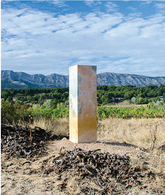
Peinture debout N° 6 2017

Ciment blanc avec sable blanc et pigments de Roussillon (Usine d'ocre Mathieu), chaux, argiles de la carrière Richeaume et de la Ste. Victoire, Poudingues de la Galante (marbres de la Ste. Victoire), 240 × 60 × 60 cm