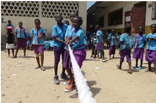
Jeux d'enfants 1 2017 Vidéo installation

Il est souvent question d'altérité dans la production artistique de Badr El Hammami, de négociation, de co-construction et d'échange. Dans de nombreux projets, sa pratique s'envisage in situ dans la relation qu'il peut mettre en place avec les personnes qui l'entourent. Ainsi, qu'il collabore avec des vendeurs ambulants ( Côte à côte ), des enfants d'école primaire ( Jeux d'enfants ), ou d'autres artistes ( Offre spéciale ), il s'attache à créer des formes qui répondent aux contextes de réalisation dans lesquels elles s'inscrivent. Dans ses œuvres, les notions de déplacement, de migration, de frontière et de politique traversent des problématiques plus personnelles liées à la mémoire et à la famille. Badr El Hammami travaille sur cet enchevêtrement qui lie la petite et la grande histoire. À travers des gestes simples (peindre et brûler des cartes postales, scinder un jeu d'échec par un mur, ...) ou des réalisations plus complexes se construisant dans la durée (l'étude de correspondances par cassette audio entre la France et le Maghreb), il élabore une œuvre dans laquelle la circulation de la parole apparaît comme une nécessité vitale.