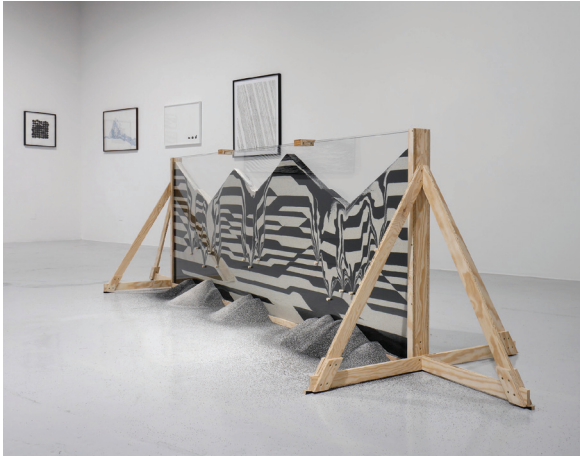
Vue de l'exposition L'horizon des particules , Vidéochroniques, Marseille, 2019

La scénarisation du réel et la poétisation de contraintes matérielles sont au cœur de la démarche de Pierre Malphettes. L'artiste emprunte au monde industriel et à l'univers de la construction pour réaliser une œuvre de sculpture qui cherche à matérialiser des phénomènes et éléments naturels (arc-en-ciel, nuage, paysage, etc.). Aux matériaux de construction, comme la bêche ou le caillebotis, peuvent s'ajouter des éléments plus inattendus comme l'air, la lumière, le verre ou même l'eau. Cette matérialisation de l'immatériel, selon une constante de la métaphore du déplacement, conduit à la création d'une réalité perceptive et sensorielle, d'un espace entre nature et artifice. Le potentiel de rêverie et la poésie qui en résultent vont paradoxalement de pair avec une matérialité assumée, un rapport fortement visuel à la matière pour créer des effets de réel. L'artiste se joue des dualités habituelles d'intérieur et d'extérieur, de solide et d'évanescence, ou de haut et de bas, afin de favoriser ce qu'il nomme « l'impermanence » (soit le décalage, l'éphémère ou encore la réversibilité) et l'expérimentation d'espaces mentaux.