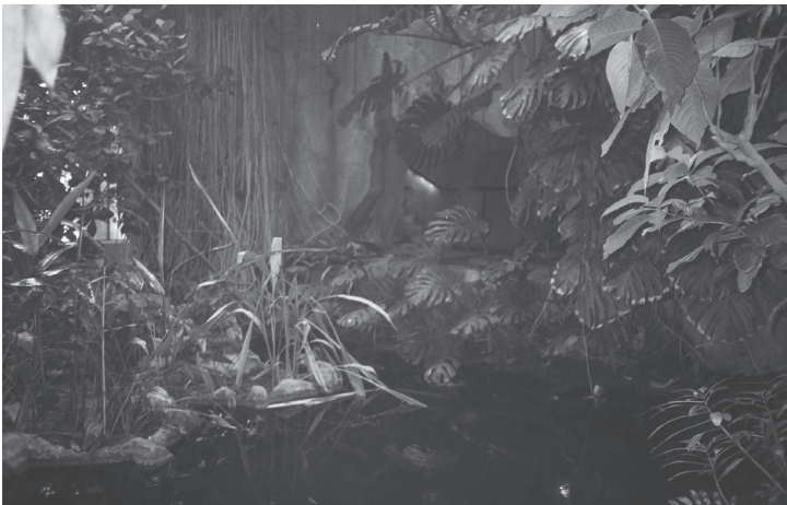
Autre Rive 2018 Ensemble de douze photographies argentiques