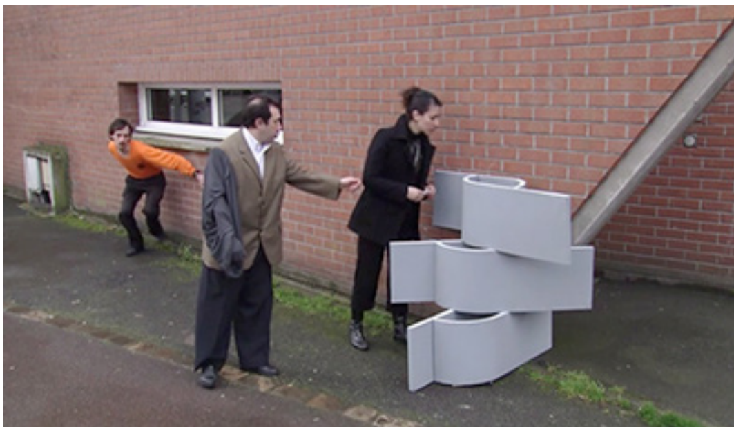
Roubaix 3000 , vidéo de 9 minutes, 2007, production Le Fresnoy, Studio national des arts contemporains, Tourcoing.

Né en 1982, vit et travaille entre Paris et Bayonne