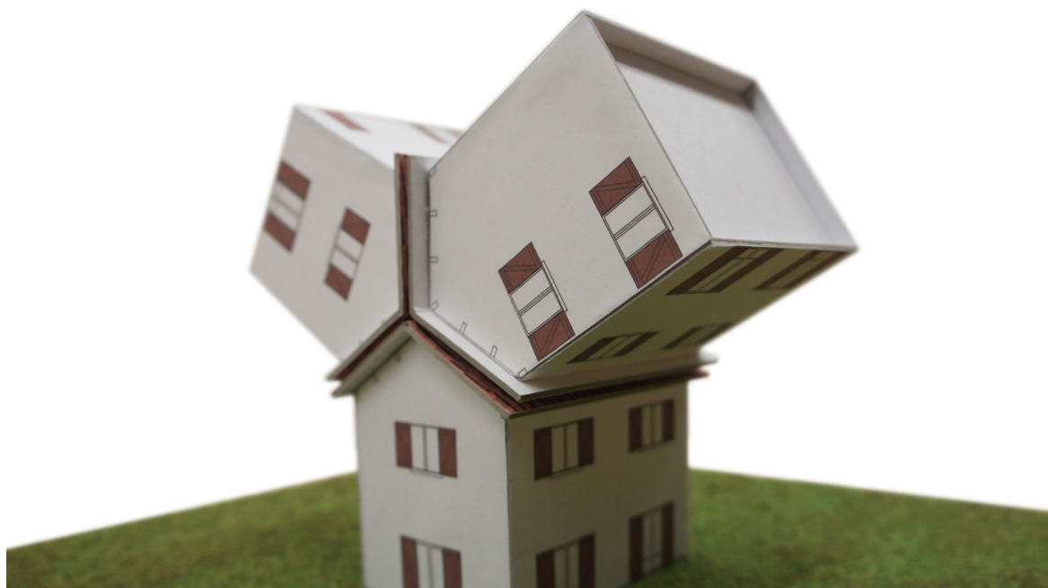
L'agrandissement de la maison de lotissement , maquette, 2012.

« Le travail de Benedetto Bufalino est aujourd'hui résolument tourné vers l'espace public. Ses œuvres sont faites dans la rue, les parcs, les jardins et autres places des villes, mais aussi réalisées pour et avec ses habitants. (...) »