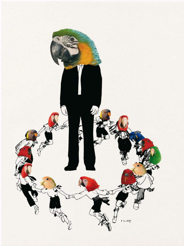
Robinsonades , impressions numériques sur papier, 18 x 24 cm, depuis 2008

Ma recherche artistique prend de multiples formes (dessin, vidéo, texte, installation...) et explore essentiellement notre rapport au travail et à l'hyperactivité telle qu'elle se manifeste dans le monde de l'entreprise, le système éducatif, dans l'espace urbain, ou à travers des fictions.