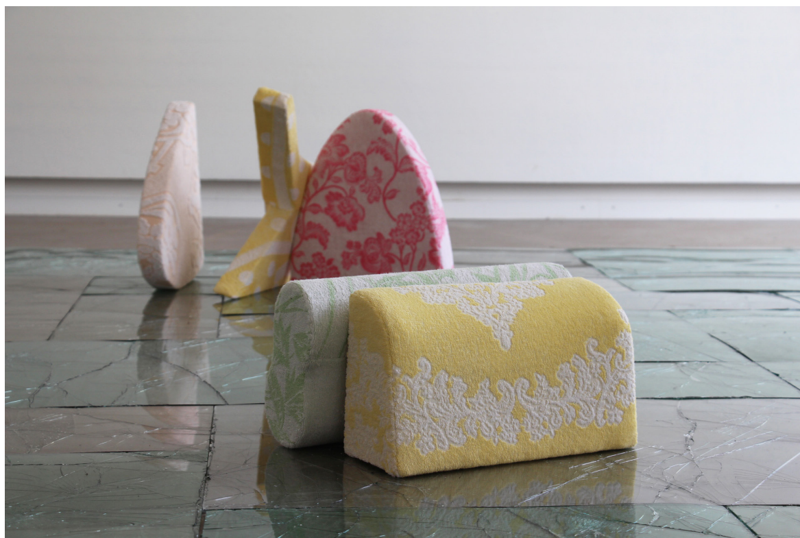
Sans titre , ensemble de sculptures, serviette éponge et matériaux divers, dimensions variables, 2013, et Dallage Opus Chaumière , pare-brises redimensionnés et carrelés au sol, dimensions variables, 2013, vue de l'exposition Quelques objets secs , Espace Kugler, Genève, 2013.

Né en 1980, vit et travaille à Saint-Etienne et Genève Représenté par la galerie White Project, Paris