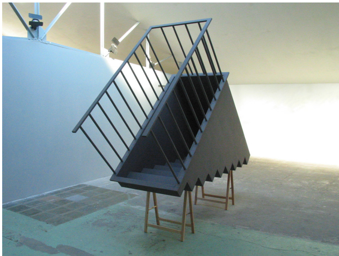
au ciel, par-dessus les toits , 2005, bois, peinture, deux tréteaux, 90 x 260 x 80 cm, vue de l'exposition Membres fantômes , lieu d'art À suivre , Bordeaux, photographie Guillaume Hillairet

Né en 1969, vit et travaille à Marseille.