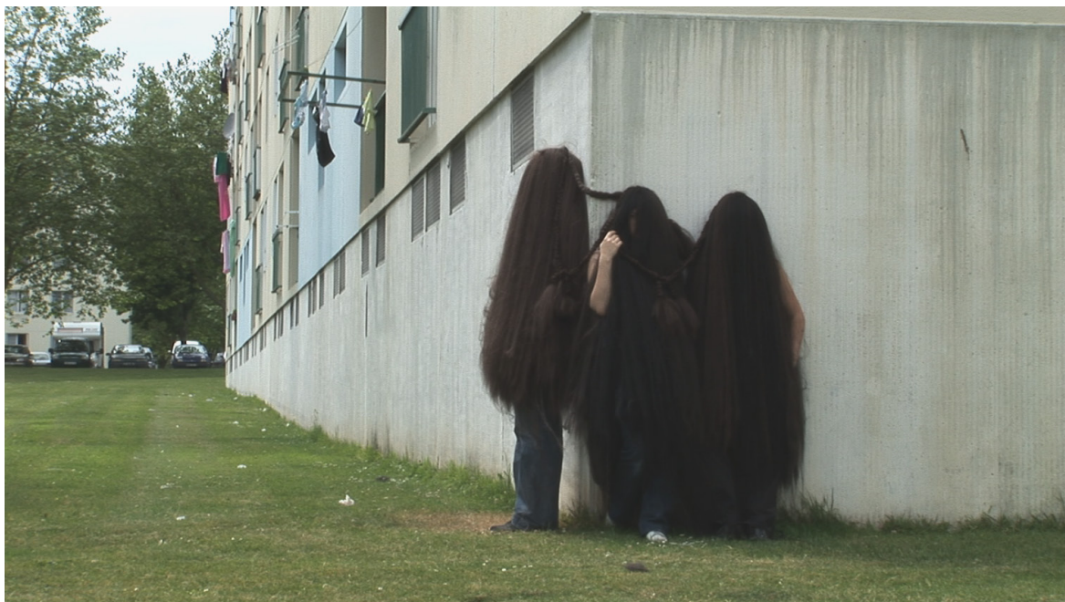
Déplacés , vidéo-sculpture de 14 minutes, 2006