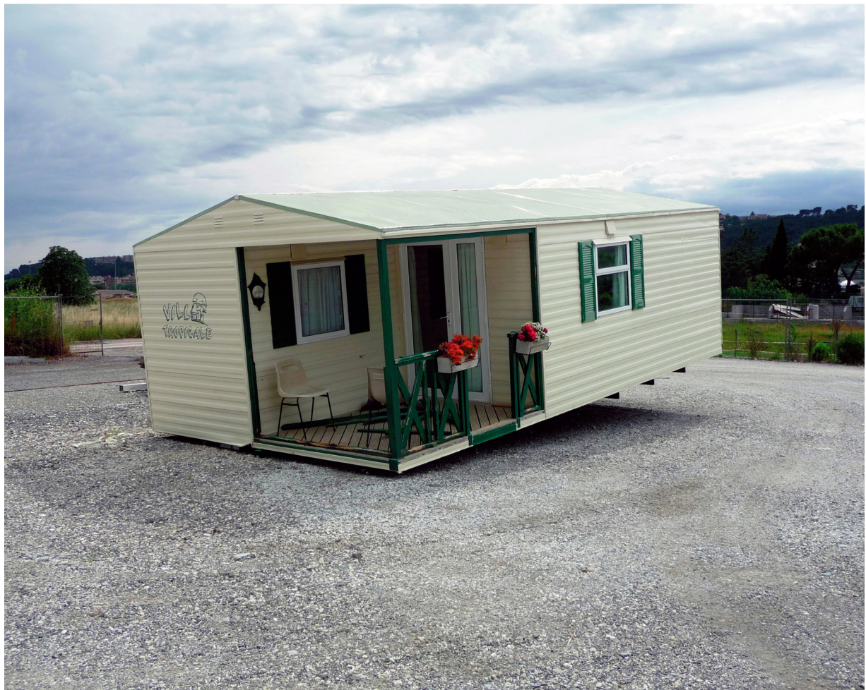
© Xavier Theunis, Sans titre (Villa tropicale), 2008, tirage lambda contre-collé sur PVC, 75 x 95 cm / Courtesy Galerie Catherine Issert et Backslash gallery