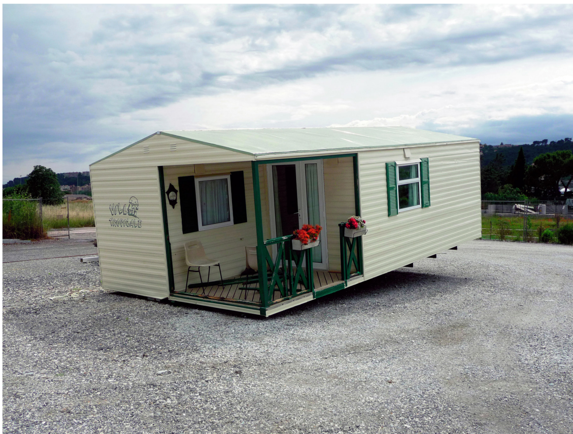
Sans titre (Villa tropicale) , 2008, tirage lambda contre-collé sur PVC, 75 x 95 cm

Représenté par la Galerie Catherine Issert, Saint-Paul de Vence et Backslash gallery, Paris