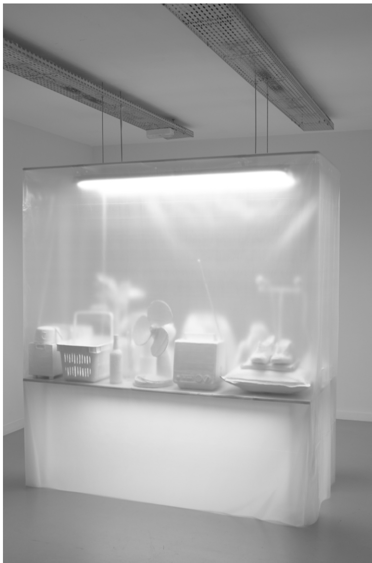
Étant volé, étant donné